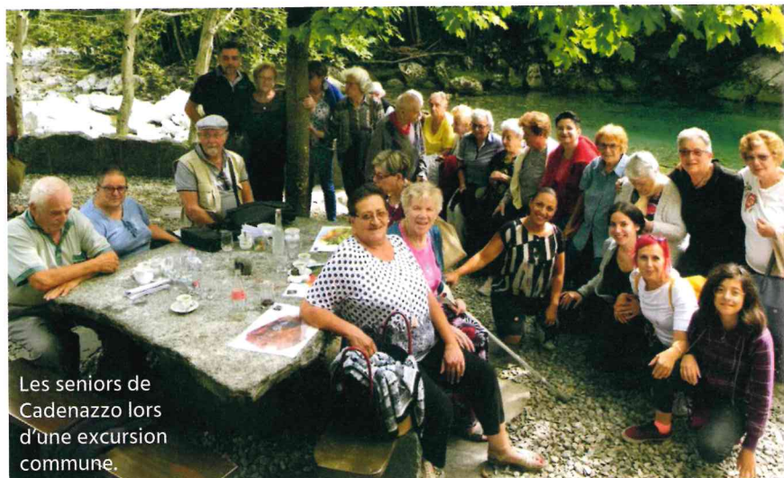
Les seniors de Cadenazzo lors d'une excursion communale.

RM: Quand une personne est subitement limitée dans sa mobilité ou dans sa vie sociale, peu importe au fond que ce soit dû à la pandémie ou à une chute, par exemple. À